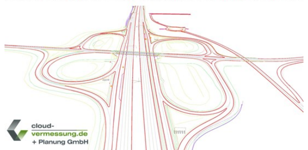
CAD-Linien eines Autobahnabschnitts erstellt durch Cloud-Vermessung + Planung GmbH